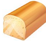
B _ _ ot