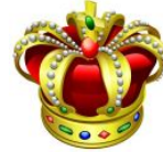
K _ _ one