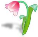
B _ _ ume