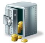
T _ _ esor