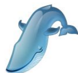
B _ _ auwal