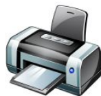
D _ _ ucker