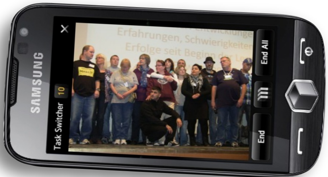
Smartphones bieten auch Lernenden neue Möglichkeiten

Die ABC-Selbsthilfegruppe Oldenburg konnte über ihre Arbeit berichten und hat sehr viel Zuspruch bekommen.