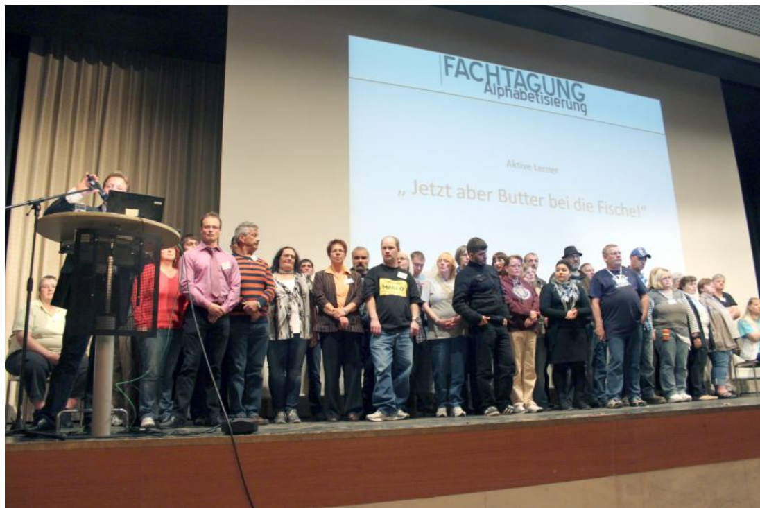
Lernende auf der Fachtagung in Bad Wildungen

Auch wir Oldenburger waren mit vier Lernern und zwei Lernbegleitern