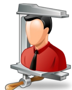
Nicht alle Menschen passen in das gleiche Schema!

Es wäre schön, wenn der Bundesverband Alphabetisierung sich für die Lernerin einsetzen würde, damit diese ihre Prüfung mündlich absolvieren kann.