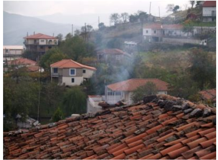
Blick von der Promenade

Die Frau guckte über die Promenade hinweg und sagte: „Oh wie schön ist hier die Landschaft.“ Aber sie bemerkte nicht, dass der Witzbold eine Schlange an der Leine hatte. Nach einer Weile sagte sie: „Ah, sie gehen auch mit ihrem Hund spazieren?“ Der Witzbold antwortete: „Äh, mit mei-